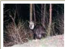
『夜のカモシカ』武田 葵

選評 なかなか夜のカモシカは撮れないですね。角が欠けている個体なんですね。夜は目が光って雰囲気もありますね。