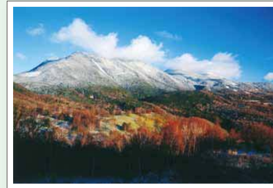
『初冬の北横岳』古屋 治

選評 手前の影の使い方が上手ですね。シャッターチャンスをしつかり捉えていて、素晴らしいと思いました。