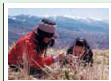
『遅い蓼科の啓蟄』宮本 寛

選評 寝そべて撮っているのいいですね。構図、シャッターチャンスが素晴らしいです。