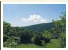
『美しい初夏の緑』児島 由美