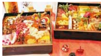
特製フレンチ&和おせち