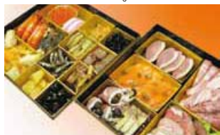
オリジナル和イタリアン特製二段おせち