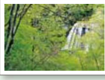
『新緑の横谷峡』古屋 治