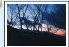
『冬暁のハケ岳』村上 俊明