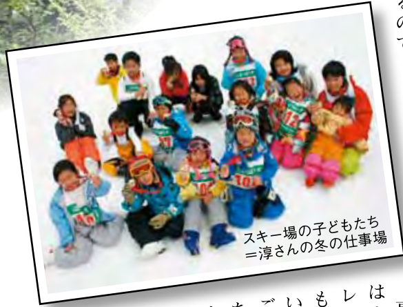
子どもたちの冬のスキー場の仕事場 ＝淳さん

「さい」と言われて母親が『クーラーはないんですよ』なんて会話が夏に一度はあるのです。 蓼科を包み込む晩秋のカラマツの色はきれいですよ。そして葉が落ちてきてもまた美しい。あつ、季節が変わってきただけで自然が教えてくれるのです。住んでいるからこそわかる、ドラマチックな季節の風景の移ろいに、何とも言えない良さがありますね。信州の自然を愛してやまなかった