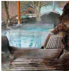
蓼科温泉「小斉の湯」 TEL: 0266-67-2121

目にも眩しい緑の前に、眼下の湖面が強める煌めき。いつものように西陽を浴びて、蓼科の夕暮れは始まりを見せる。時計の針が五時を指す頃、耳に聞こえし鐘の音。湖畔で鎮まる聖光寺が、荘厳な音調を大気に混ぜた。溢れる源泉を湯枕に、梵鐘の癒しを請うてみたい。隔世の高原に来た時ぐらいいい、こんな贅沢も良いではないか。普段気を張る自分のために、これから輝く自分のために。