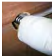
途中でしか凍結防止帯が無い例