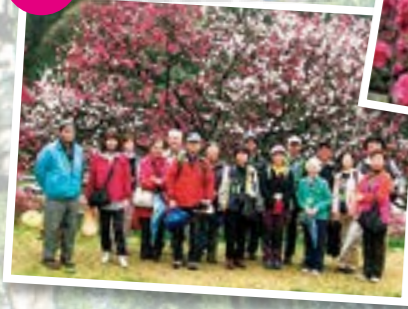
花桃を眺めた後は、 温泉に入りました! 遅い春をゆったりと 堪能しましたよ!