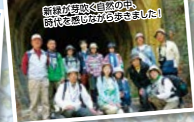
新緑が芽吹く自然の中、 時代を感じながら歩きました!