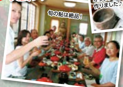
世界に一つだけの オリジナル陶芸も 作りました!