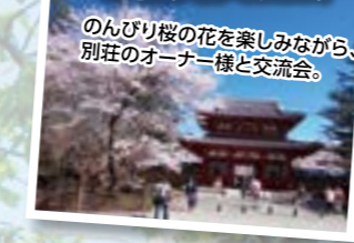
のんびり桜の花を楽しみながら、 別荘のオーナー様と交流会。