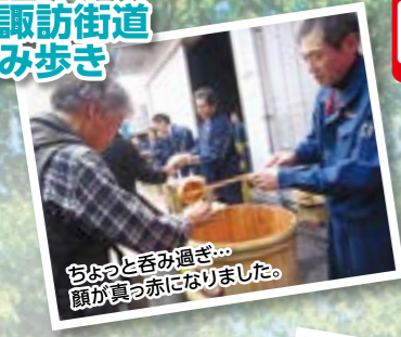
ちよと呑み過ぎ... 顔が真っ赤になりました。