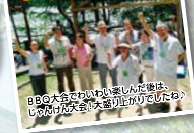
BBQ大会でわいわい楽しんだ後は、 じやんけん大会!大盛り上がりでしたね!