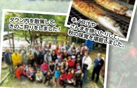
タウン内を散策して、 きのご狩りをしました!