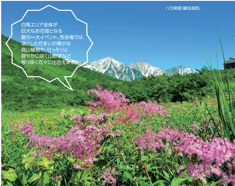
八方尾根「鎌池湿原」

開催：2019年7月1日(月)～8月31日(土) 問 白馬村観光局 ☎0261-72-7100