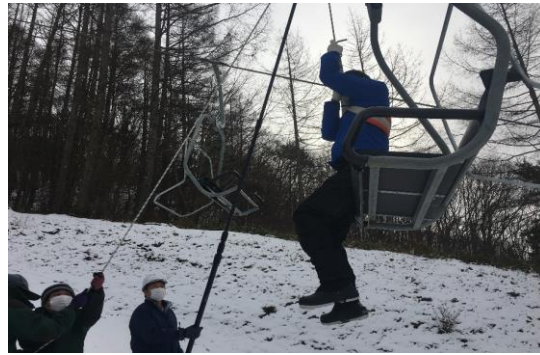
【冬季勤務前救助訓練】